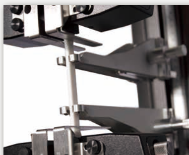
電気機械式フレームにおいてAutoX750を用いた塑性引張試験