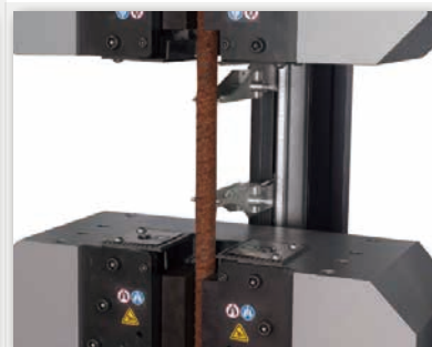
1500KPX油圧式フレームにおいてAutoX750を用いた鉄筋棒鋼試験