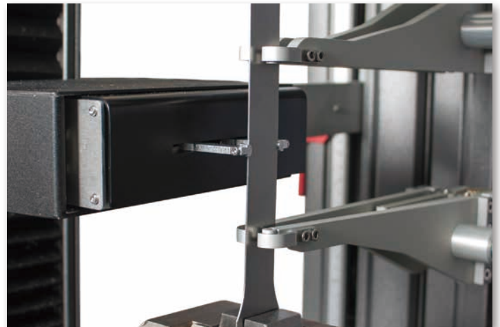
標点距離の中心を自動的に測定