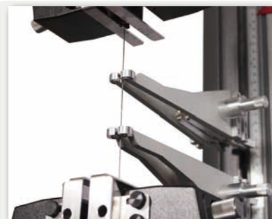
AutoX750と空圧式サイドアクショングリップに保持された炭素繊維の短繊維